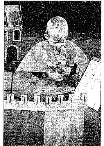
Een heus kasteel op het Ridders- en prinsessenfeest in Ravelijn.

Dat kan tijdens de openingsuren op dinsdag 9.00 tot 11.00 uur en donderdag 15.15 tot 16.30 uur (behalve in schoolvakanties). Bij aanmelding is legitimatie met naam en adres verplicht. Jaarabonnement 10 euro.