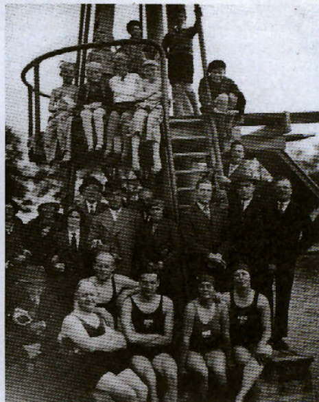
1932: Zwembad de Liesbosch.

De wijk kende ook voetbalclubs: de algemene club RUC, de roomse KDS en een plaatselijke HVV die niet lang heeft bestaan. Bij de 'Rotte Uien Combinatie' en